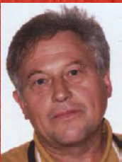
Hans Hermann Drüen Sportbildungswerk des LSB NRW e.V. Außenstelle Badminton