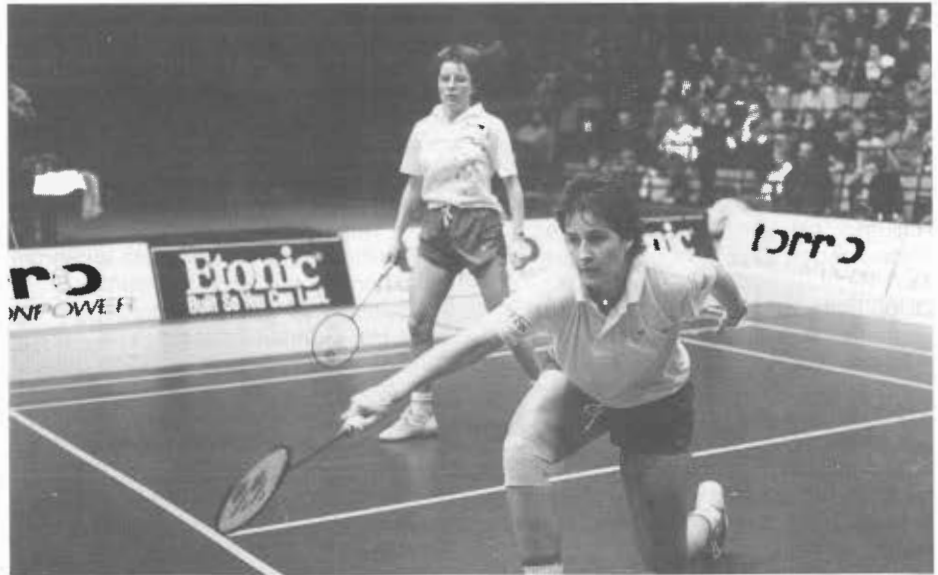
So soll es auch 1993 werden: spannende Spiele, guter Besuch und tolle Präsentationen.

Also Termin vormerken und rechtzeitig Karten reservieren: