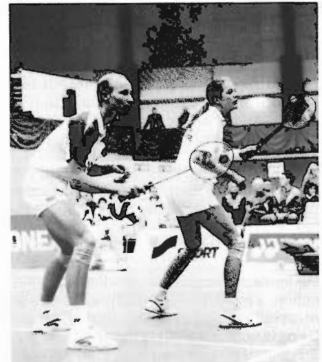
Thomas Lund/Pernille Dupont (DEN) – Gewinner der Mixed German Open 91 + 92; Nr. 1 der Weltrangliste

Die kompletten Ergebnisse können gegen Einsendung eines frankierten und adressierten Briefumschlages bei der GST des BLV-NRW angefordert werden: BLV-NRW; Ergebnisdienst: Südstr. 25, 4330 Mülheim an der Ruhr.