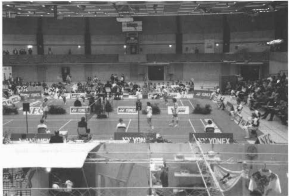
Bot einen ausgezeichneten Überblick: die Rundsporthalle in Leverkusen

Im Viertelfinale gegen Darren Hall war eine weitere Überraschung greifbar nahe. Beide Kontrahenten waren nahezu gleichwertig (11:15/15:12/13:15 aus Olivers Sicht), wobei gegen Ende des Spiel der Deutsche mit beginnenden Wadenkrämpfen und seinem Gegner zu kämpfen hat-