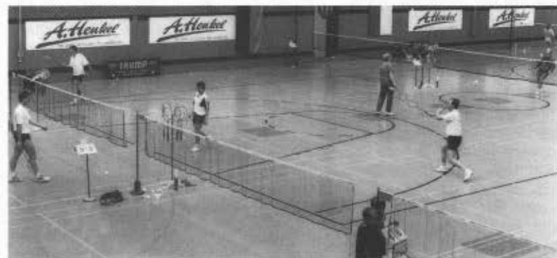
Blick in die Großraumhalle bei der Coach Olympiade 1992.