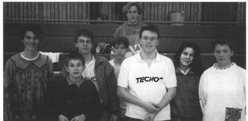
Jugend: TTC Brauweiler