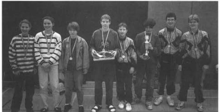
Schüler: FC Langenfeld