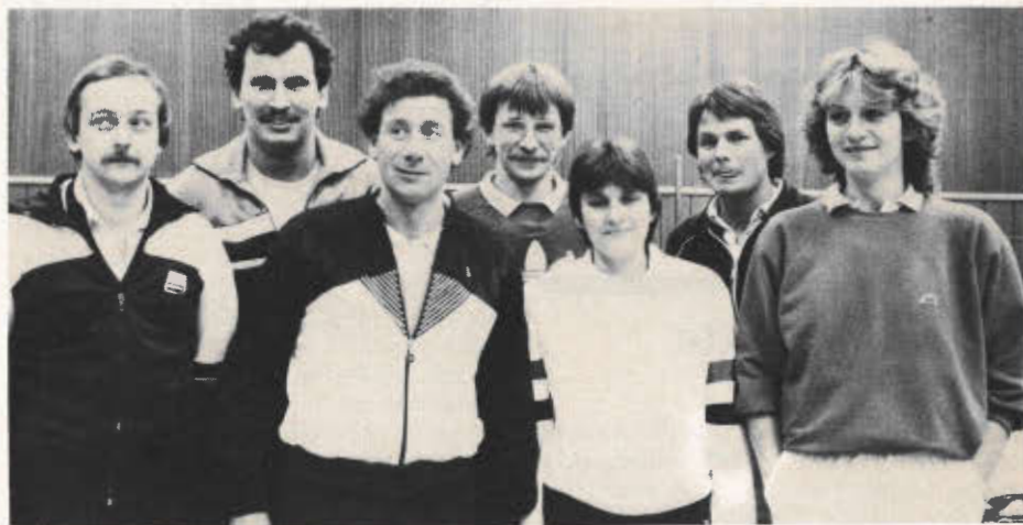
Aufsteiger BC Burg

Nach dem nur denkbar knappen Abstieg aus der Bundesliga ist die Truppe entgegen allen eigenen Erwartungen total auseinandergefallen. Da sich auch die 2. Mannschaft der Solinger im letzten Jahr nicht in der Oberliga halten konnte, ist aus dieser Mannschaft nur Manfred