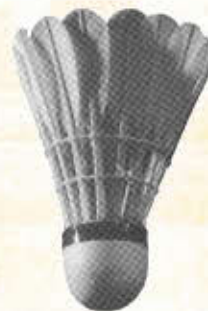
VICTOR G 1132