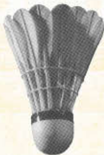
VICTOR G 1101