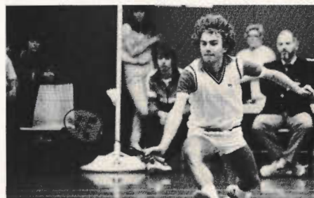
Uwe Scherpen

Im GD wurde Renzelmann/Hoppe sicherer Sieger. An ihnen war im HF Dieckmann/Voltmann gescheitert.