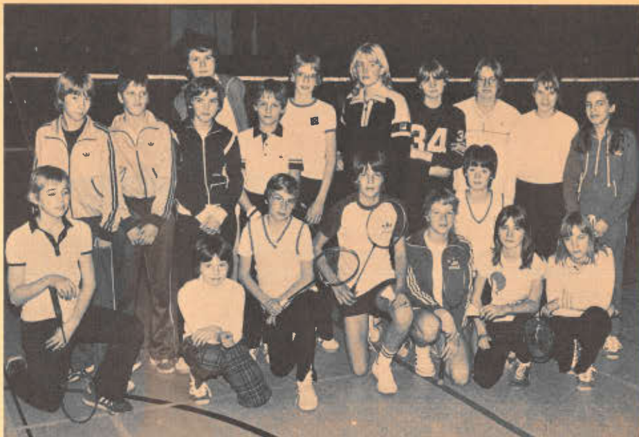
Einige erfolgreiche, strahlende Endrundenteilnehmer und Bezirksmeister 1980/81 der Schüler aus dem Bezirk Nord I