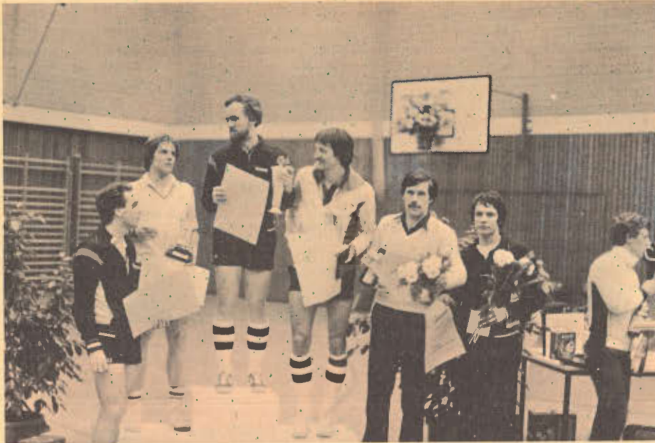
Siegerehrung im Herren-Doppel.