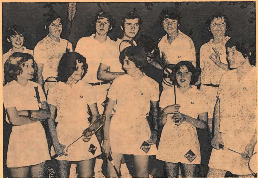
Es zeigt sich immer wieder, daß durch eine gezielte Werbeaktion aus dem Nichts etwas geschaffen werden kann. Auf dem Foto sehen wir einige Jugendliche des DJK VfL Rheinwacht 1924 e.V. Kempen, die sich aus einer Gruppe von fast 65 herauskristallisiert haben und in ihre erste Saison gehen.

Die Badmintonabteilungen des TuS 04 und Tb 05 Rheinhausen