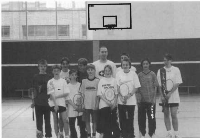
Die Lehrgangsteilnehmer 1. LG U13/U15 in Gütersloh