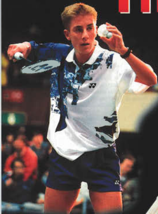
Peter Gade Christensen, Sieger YONEX OPEN JAPAN 1998, World Ranking #1