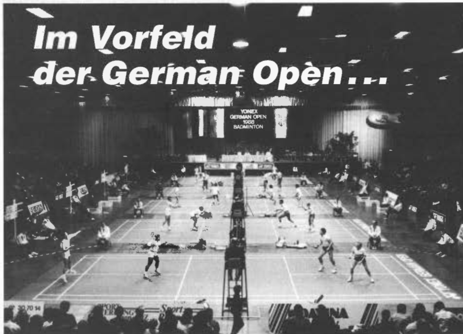
Philipshalle in voller Badmintonpracht

YONEX GERMAN OPEN 1989 Philipshalle Düsseldorf 4. bis 8. Oktober 1989