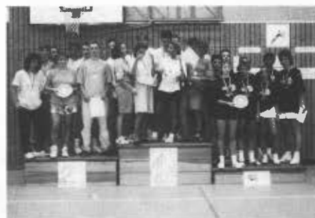
Die Sieger der Olympischen Metalle: 1. Mülheim/Ruhr, 2. Essen, 3. Dortmund

Nach zwei Tagen voller Spannung, Schweiß und Dramatik ging auch diese gelungene Veranstaltung zu Ende. Man ist gespannt, wer im nächsten Jahr die Nr. 1 des Ruhrgebiets im Badminton werden wird. Gesamtsieger der Ruhrolympiade wurde Essen mit 133,5 Punkten vor Dortmund (124 Punkte) und Bochum (107 Punkte).