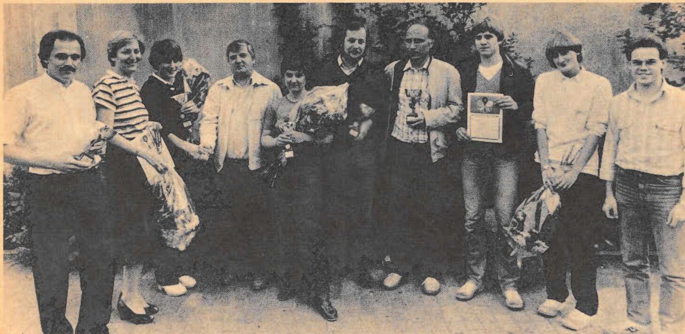
Strahlende Gesichter bei der Siegerehrung.